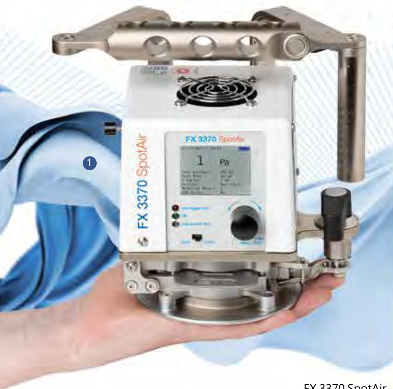
FX 3370 SpotAir 在线手提透气性分析仪 测试报告

附带手提箱保护仪器，方便在工厂内轻松安全的搬运仪器。如需要到供应商或客户方进行演示或测量，仪器箱内的固定物料能保护仪器，承受长途运输。